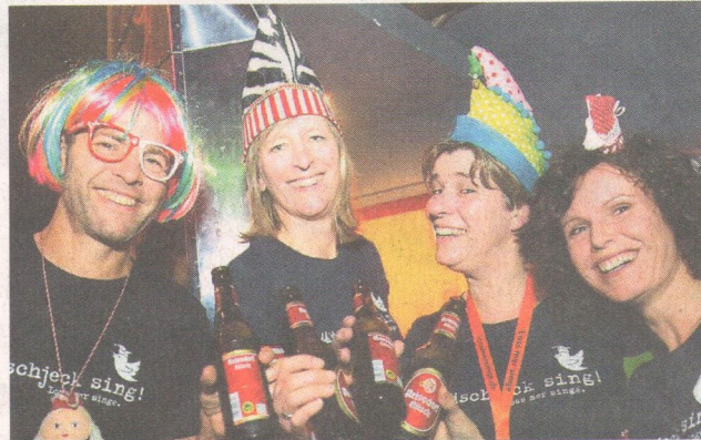
Alaaf! Mitglieder des Köln-Münchner Karnevalsvereins Superjeilezick (KMKV).